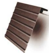
J-фаска (ветровая доска) Закрытие лобовой доски на карнизных свесах