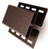
H-профиль Соединение софитов на углах карнизов.